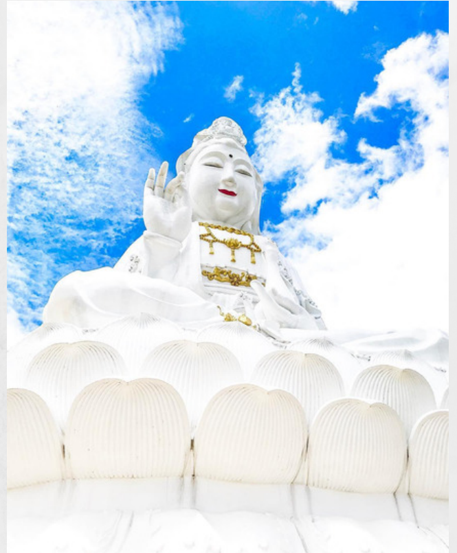
WAT HUAY PLA KUNG