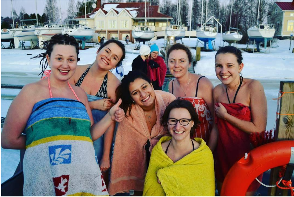
Koupání v moři 4. 12. 2017 – Lapland survivors