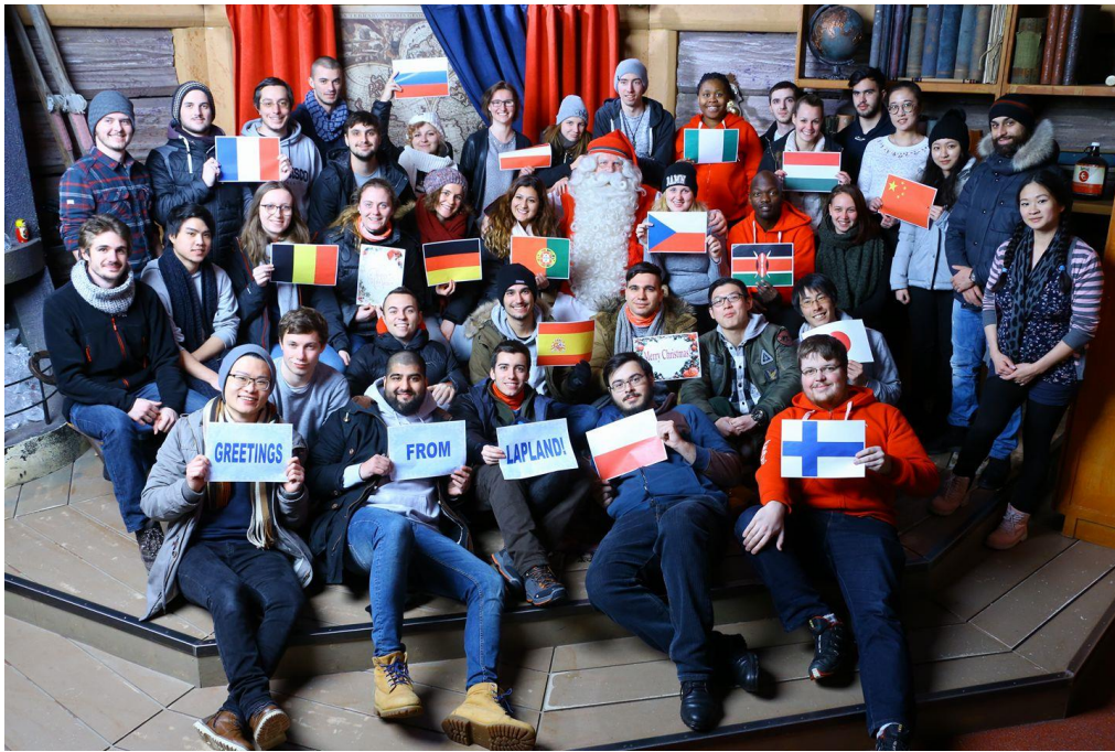
Santa claus village – all erasmus group, winter semester