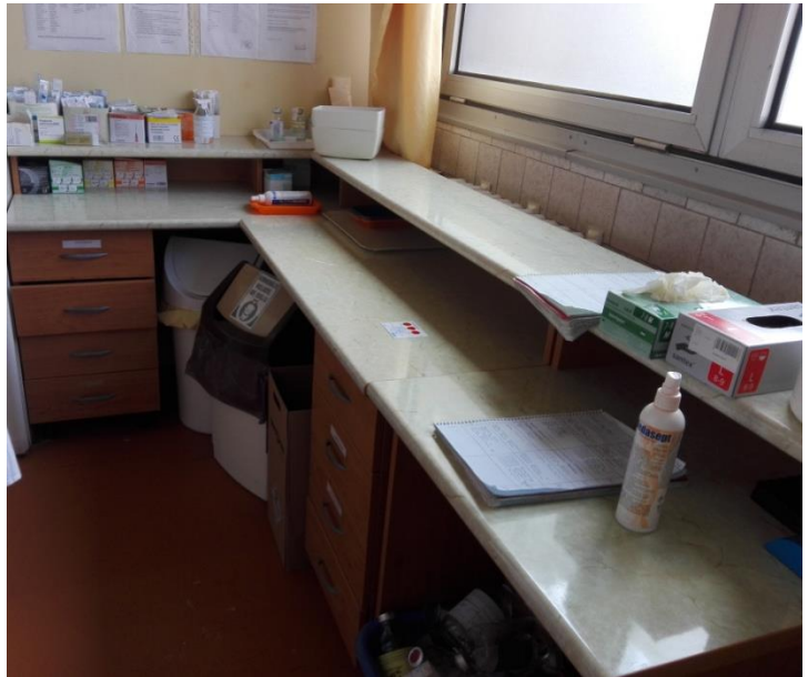
obr. Sesterna na chirurgii

Chirurgie: Třetí týden jsem celý strávila se studentkou 4. ročníku všeobecné sestry jménem Emese Czipka na ženské části chirurgického oddělení. V první řadě musím říct, že ač zde stále byla jazyková bariéra, sestry se ke mně chovaly hezky a braly mě na vědomí. Jedna dokonce zkusila mluvit nepatrnou ruštinou, které jsem nepatrně rozuměla a tím jsem získala možnost chodit na výkony pouze s ní. Díky tomu jsem se necítila tak ztraceně. Zde jsem se také zapojila do převazů, protože jsem upozorovala podobný systém jako u nás, tak to nebyl problém. Čtvrtý týden jsem strávila na mužském oddělení chirurgie. Tento týden jsem měla novou studentku jménem. Byla hodná a komunikovala se mnou. Zde jsem si natočila několikrát EKG, také jsem měřila krevní tlak a podávala infuze. Na tomto oddělení byl zdravotní bratr, který uměl anglicky, proto s komunikací nebyl zase tak velký problém.