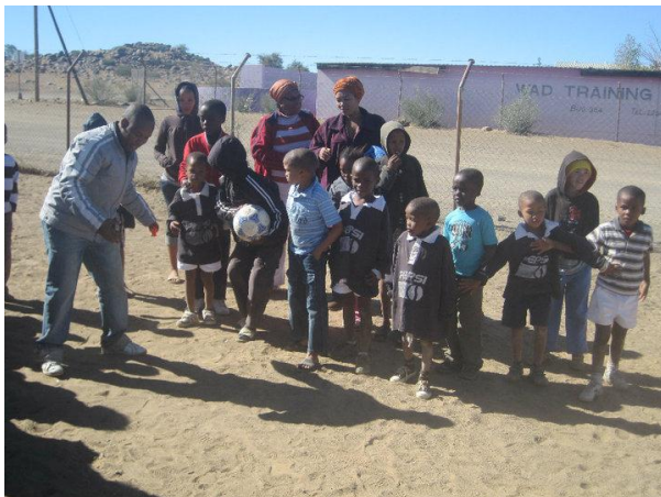
Day of the African Child v DRC