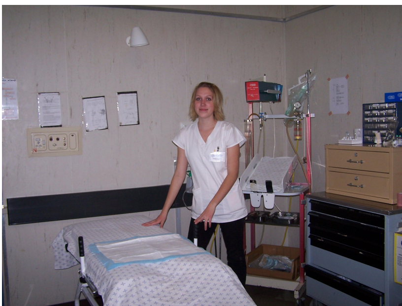
Maternity ward- provizorní porodní sál (podstatná ást nemocnice byla v rekonstrukci)