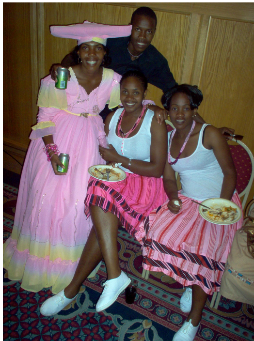
Herero (rohy), Ovambo (růžové sukně)