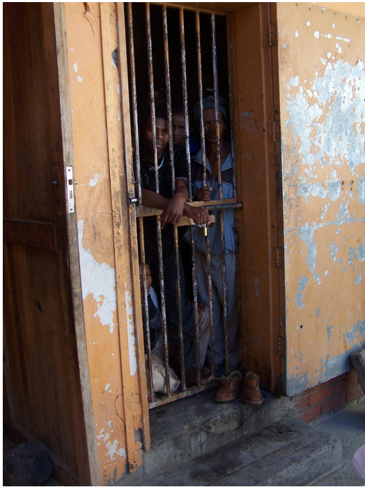
Tses- v zení