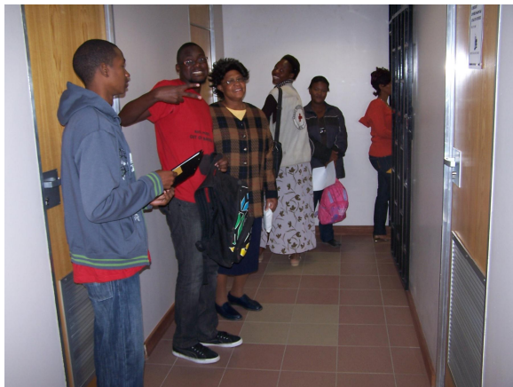
O imunizačních týmech (dobrovolníci tvořili sestry i lékaři z nemocnice a studenti)