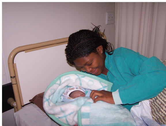
Maternity ward- porodní pé e (jifl zrekonstruovaná ást odd lení :-))