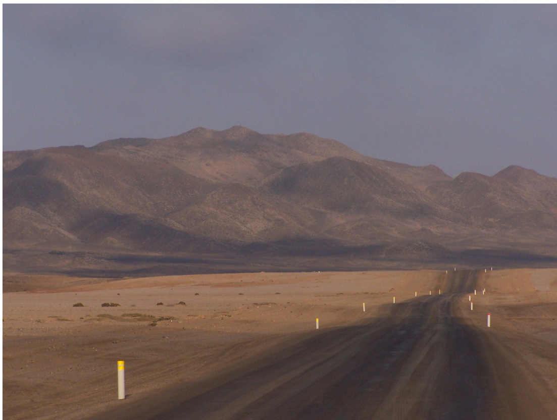
Cesta na Cape Cross