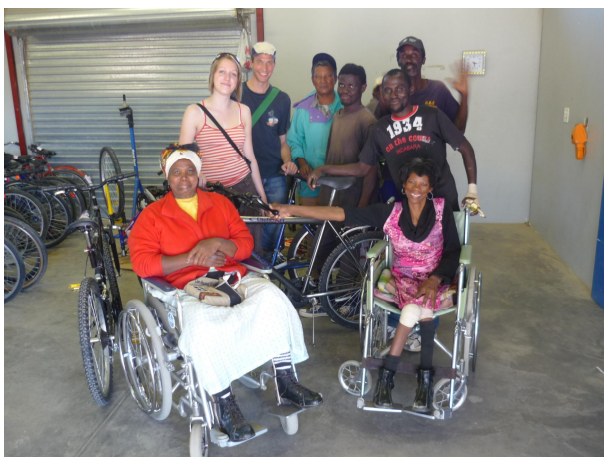
V DRC p i nákupu jízdních kol