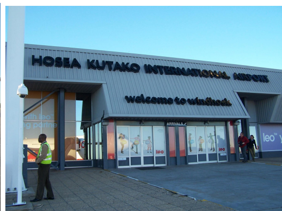
Na leti–ti ve Windhoeku