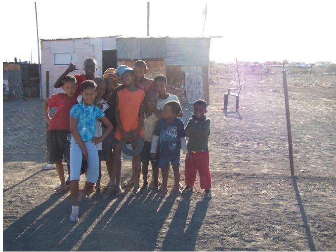
Tses- d ti hrající si na ulici

Bydlení nám poskytlo Ministry of Health and Social services zcela zadarmo a bylo super. Měli jsme v něm, co jsme potřebovali. Vlastní vybavenou kuchyň, každý svůj pokoj se záchodem a koupelnou. Bydleli jsme v budově Training centra společně s ostatními studenty ošetřovatelství. Bylo to v areálu nemocnice, takže když jsem pracovala na maternity ward, měla jsem to do práce asi 5 minut pěšky. Dál to bylo do města, jelikož nemocnice stojí asi 5 km od centra Keetmans. Ale s dopravou tam jsme nikdy neměli problém.