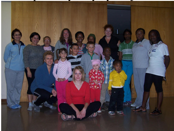
Tane ní tým . 2