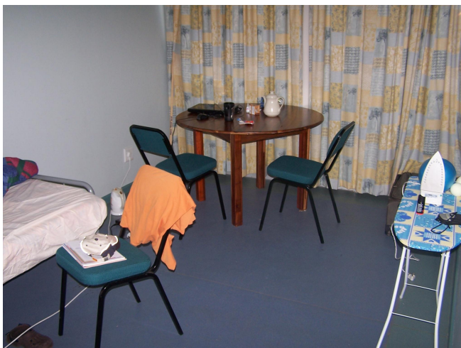
Pokojík . 2