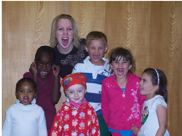
Ná-tane ní tým . 1