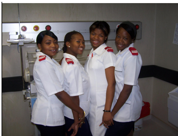
Maternity ward- studentky 2. ro níku, poznáte podle proufk na náramenicích