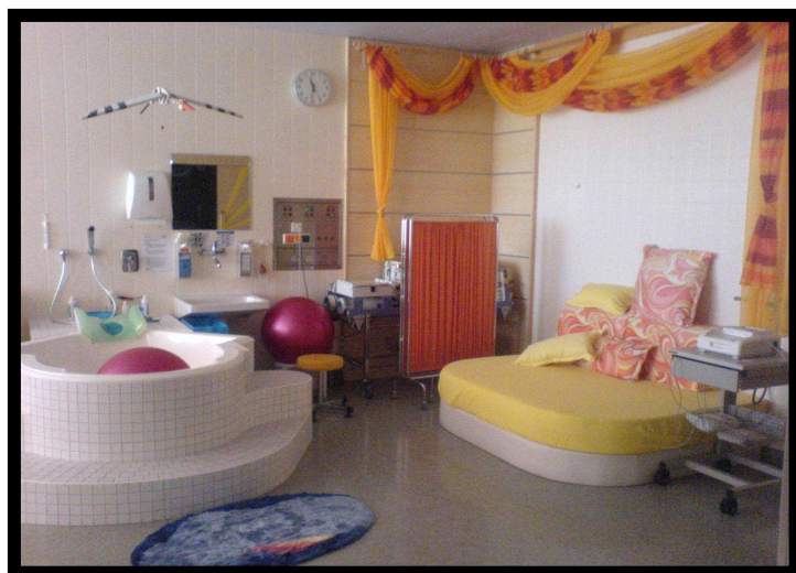
Místnost s vanou a porodní postelí