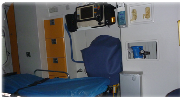
Vybavení vozu RZP