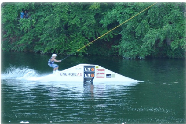
H2O Wake Parade