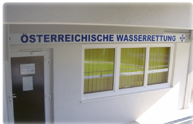
Základna VZS Laakirchen