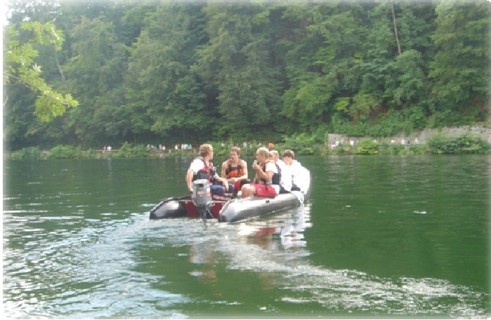
Hlídkující posádka VZS