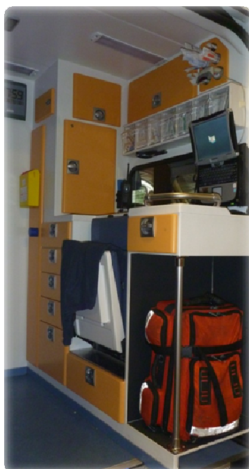
Vybavení vozu RZP