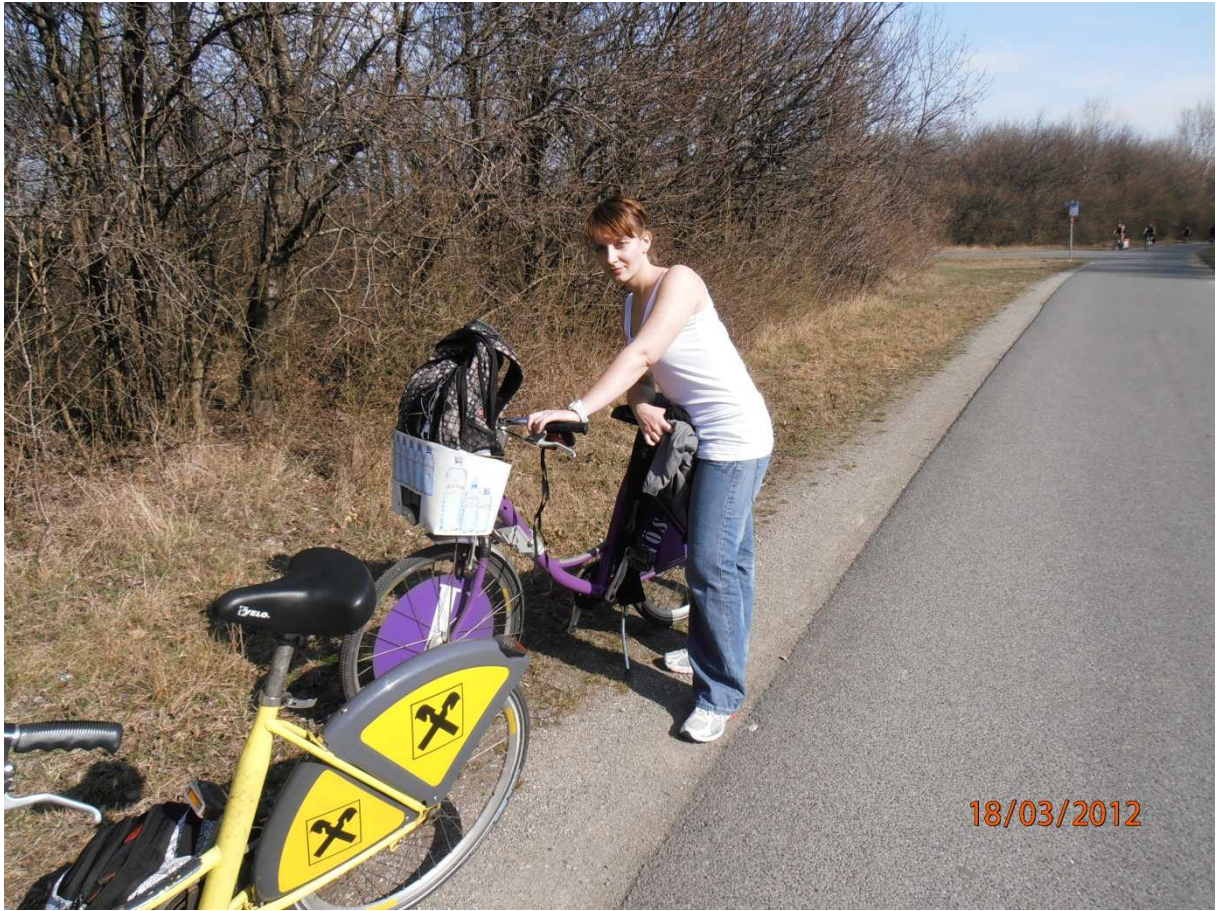
CityBike na Donauinsel