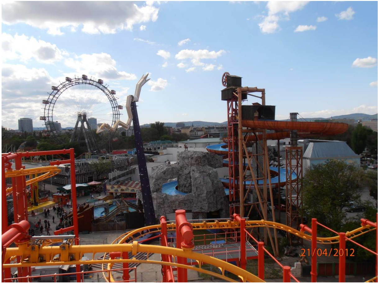
Výhled z vyhlídkového kola na Prater