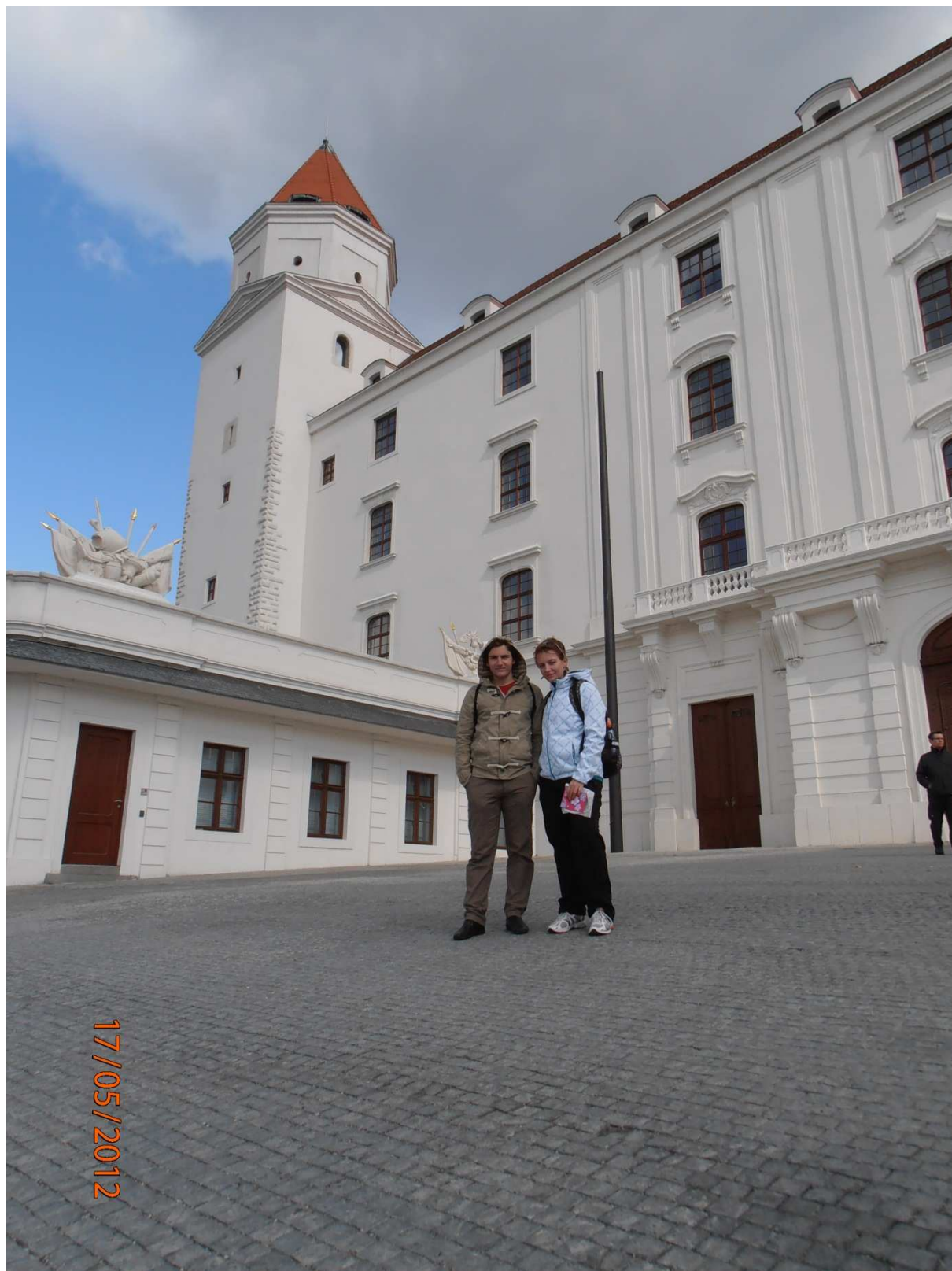
Výlet v Bratislavě