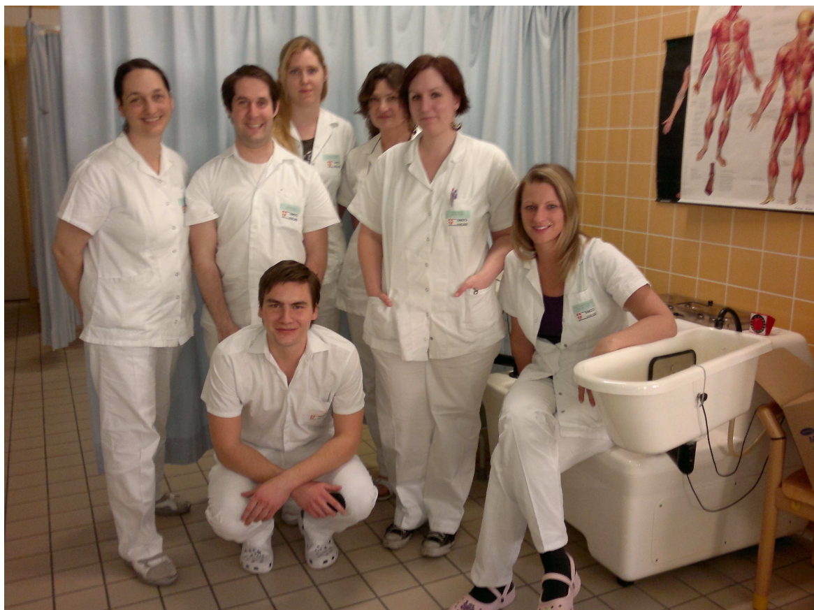
Kolegové z Wilheminspital