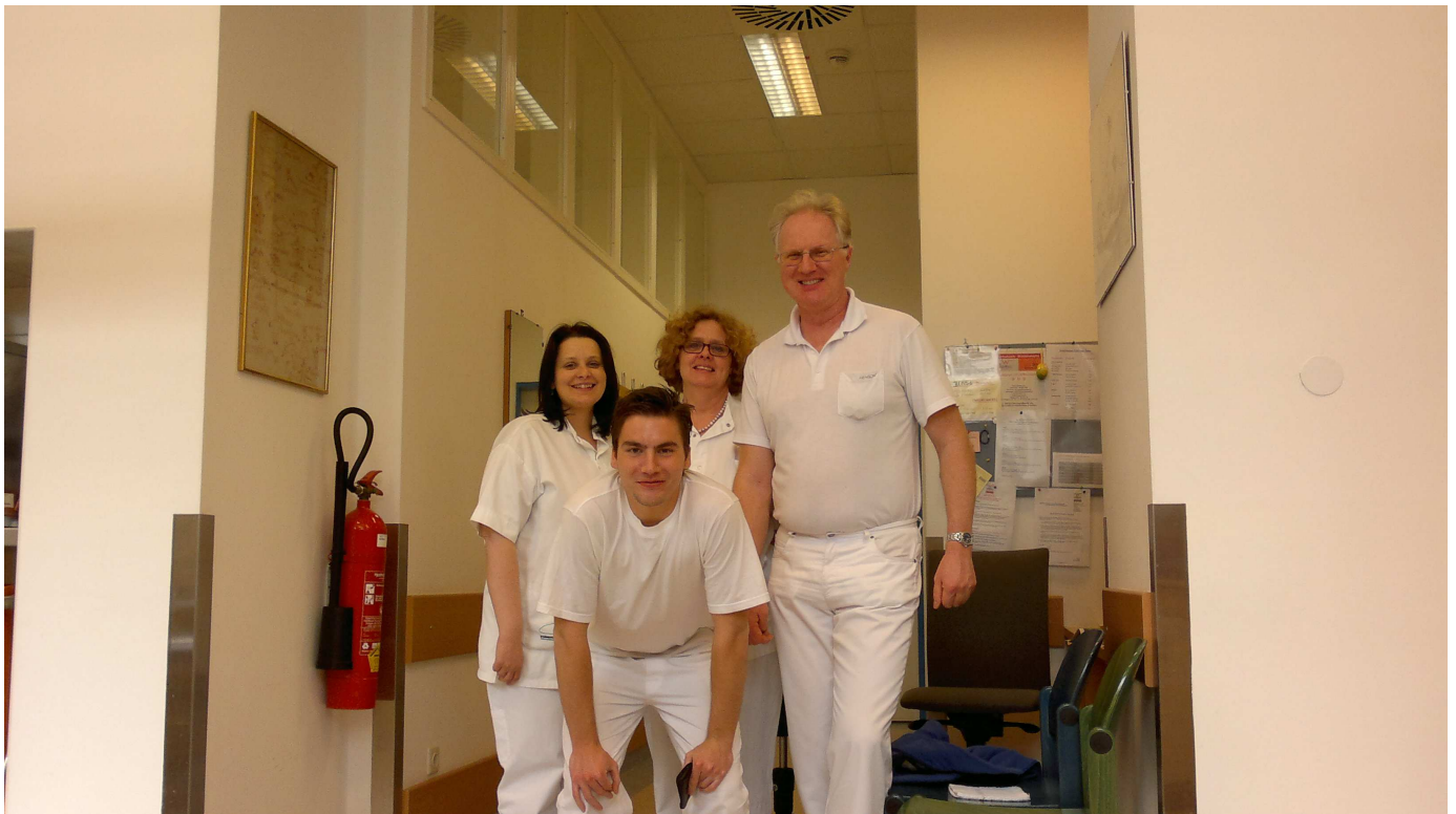
Kolegové z Donauspital