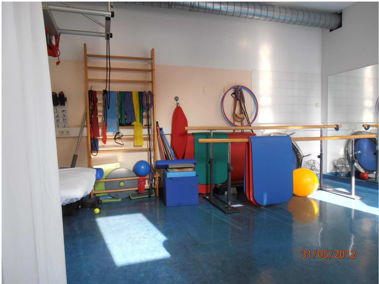
Posilovna v RZL