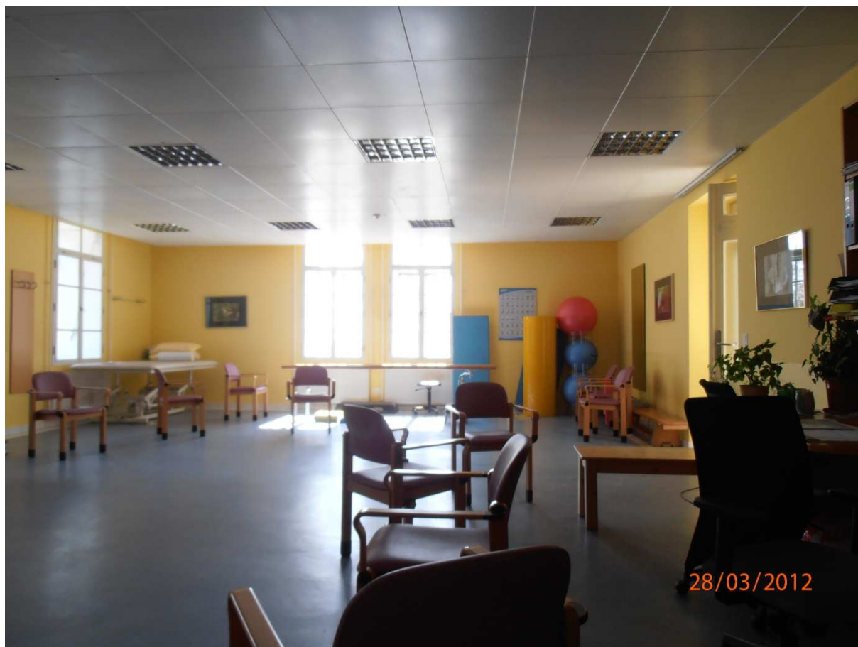
Místnost na skupinovou terapii v Otto- Wagner- Pflegezentrum