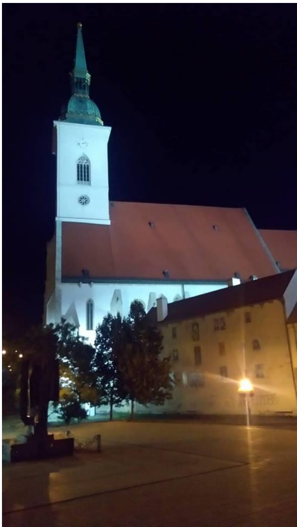
Katedrála sv. Martina – korunovační kostel Marie Terezie