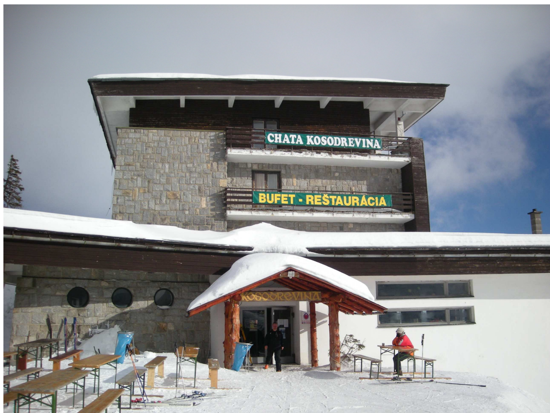
Hotel Kosodrevina – nejlepší místo na jižní straně Chopku ☺