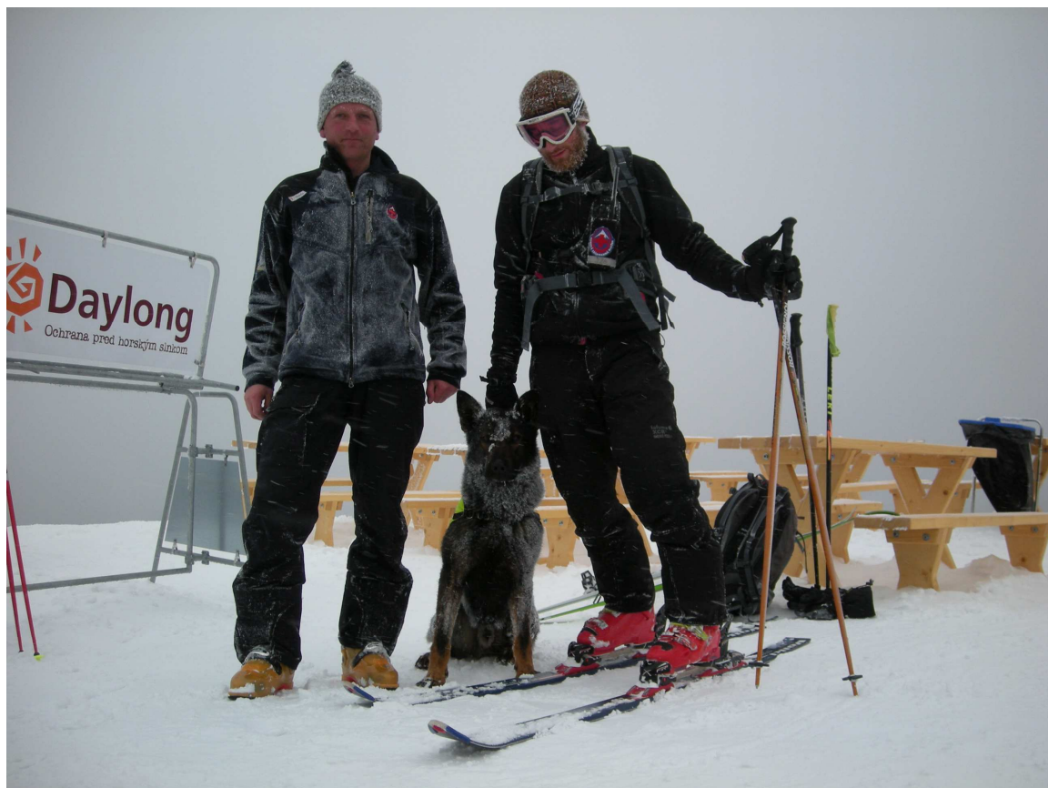
Po celodenní službě T1 – terén