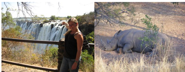
Vlevo - Viktoriiny vodopády, vpravo - nosorožec v Národním parku

Měla jsem možnost podívat se i za hranice Lusaky. Vyjela jsem například do 600 km vzdáleného Mongu, kde se nachází jeden z projektů Njovu, kde jsem se mimo jiné podívala do přístavu, do kešu oříškáren či na krokodýlí farmu. Poté jsem navštívila turisticky nejatraktivnější Livingstone, kde jsem viděla nejkrásnější věc v mém životě - ohromné Viktoriiny vodopády. Nesmělo chybět ani safari či projížďka na loďce mezi krokodýly.:) Zajela jsem i na jezero Kariba s přehradou. Vše bylo krásné a neopakovatelné.