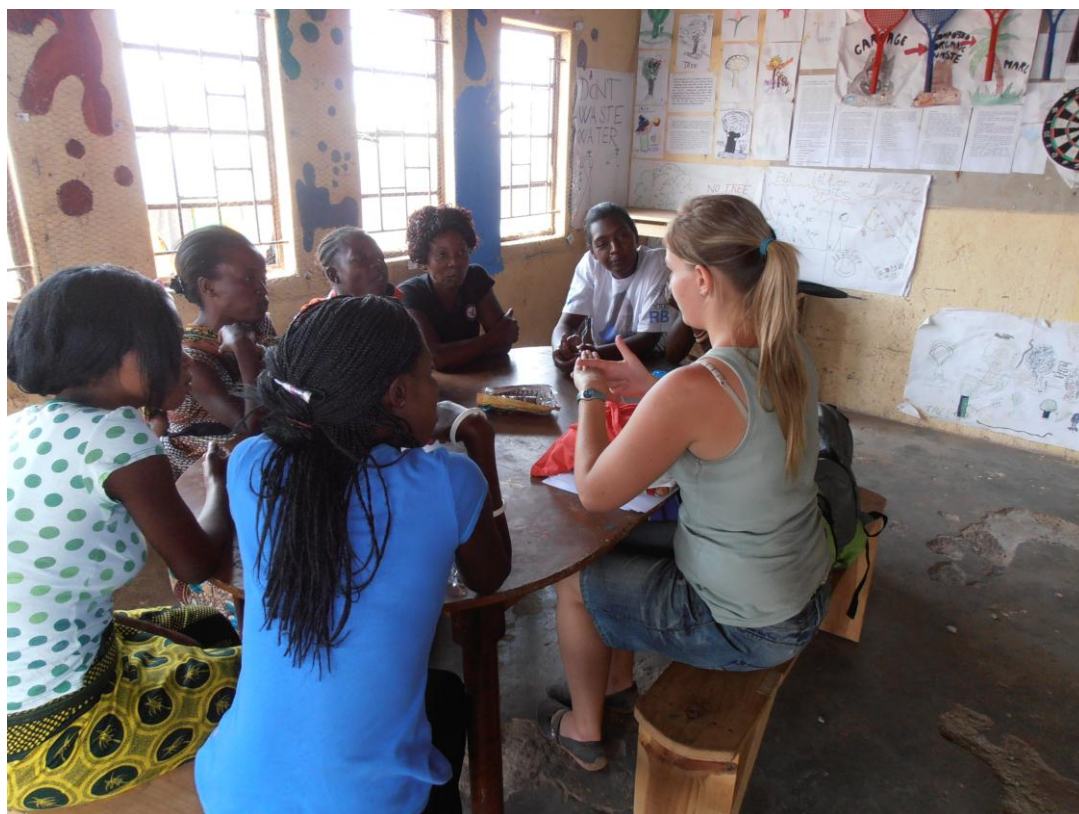
Aktivita s matkami