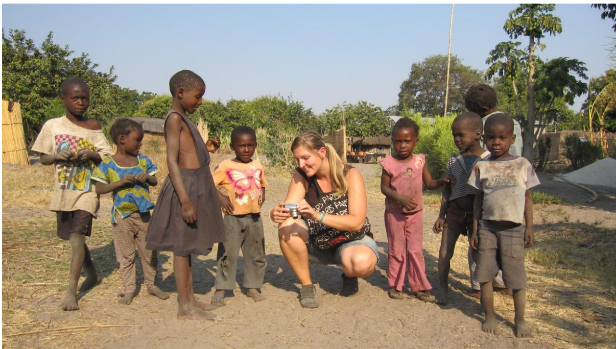
Děti milují focení a následné prohlížení fotek