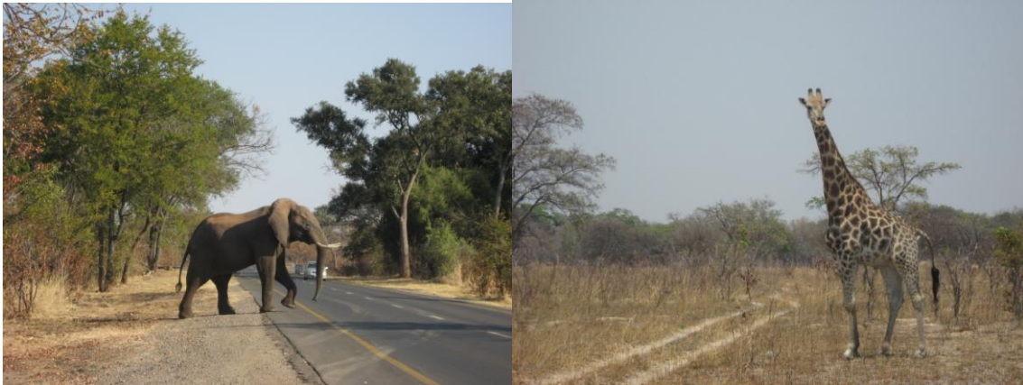
Mosi-oa-Tunya National Park