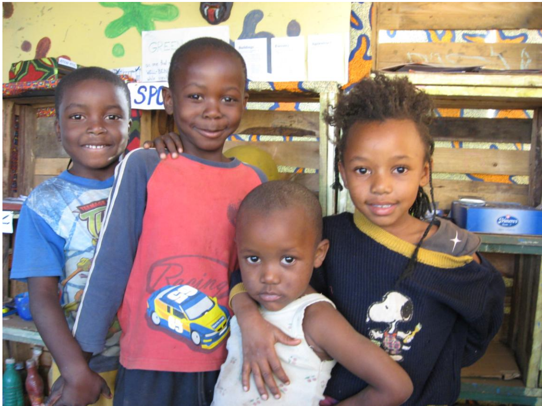
Děti v centru Ng'ombe

Njovu Zambia - Nížkoprahové centrum Ng'ombe