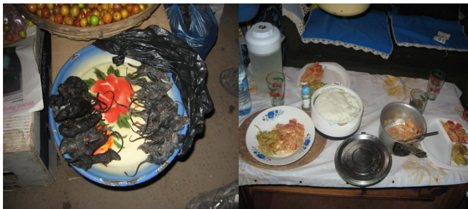
Vlevo - pečené myši; vpravo nshima se sójou a zeleninou

V Lusace lze nakoupit ve Sparu či Shopritu nebo na místních trzích. Na trzích jsem kupovala většinou zeleninu a ovoce - vyšlo levněji a bylo kvalitnější než v supermarketech. Zbytek se dal dokoupit také vcelku levně u místních obchodníků, avšak vše je vždy o něco dražší než v Čechách. Typickým zambijským jídlem je nshima s masem a zeleninovou přílohou. Nechte se však překvapit, co to vlastně je.:) Dále jsou k dispozici pečené myši, bohužel s vámi nemohu sdílet jejich chuť - neochutnala jsem.:) Proto přikládám alespoň obrázek.:)