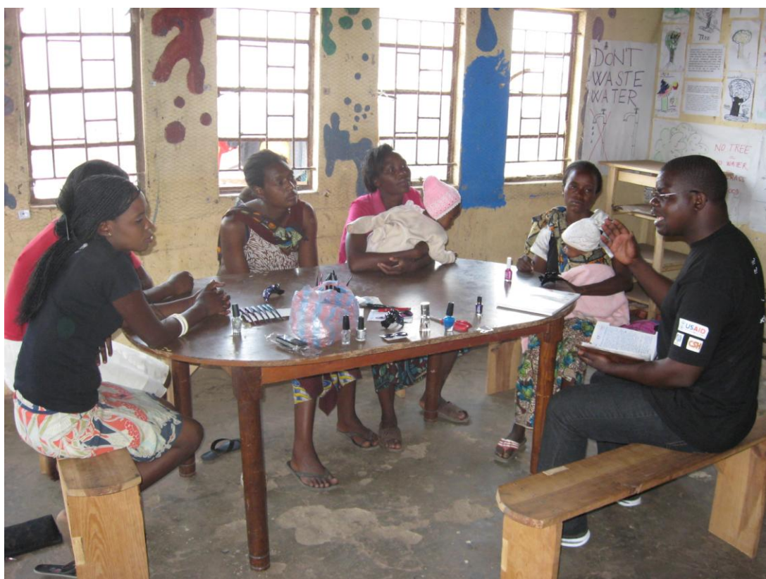
Seminár o HIV/AIDS