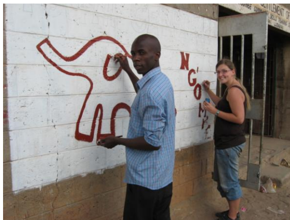
Při praxi lze dělat opravdu vše :)