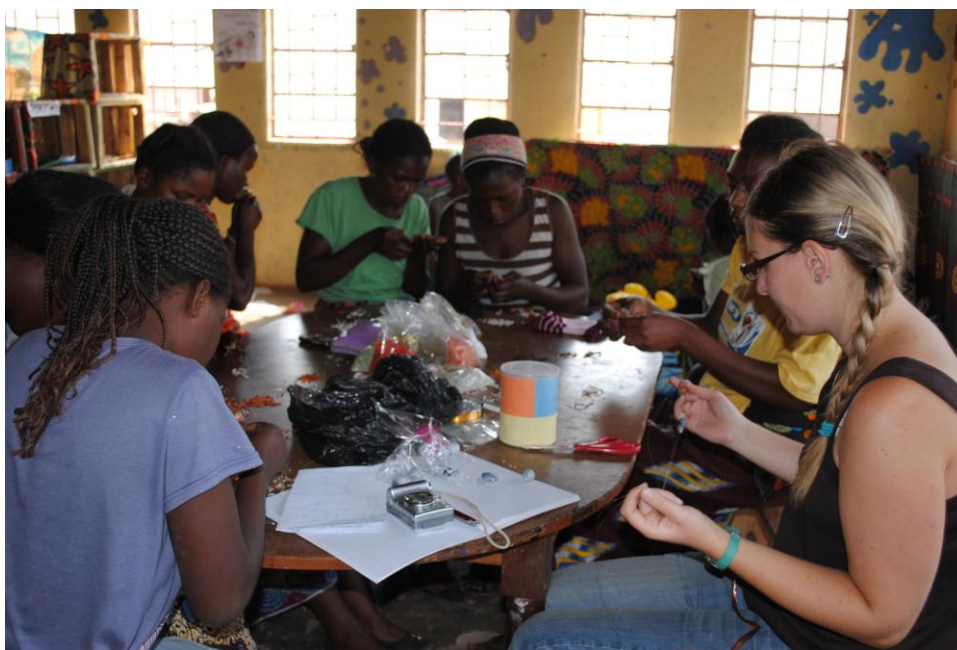
Podpůrná skupina pro mladé matky s dětmi