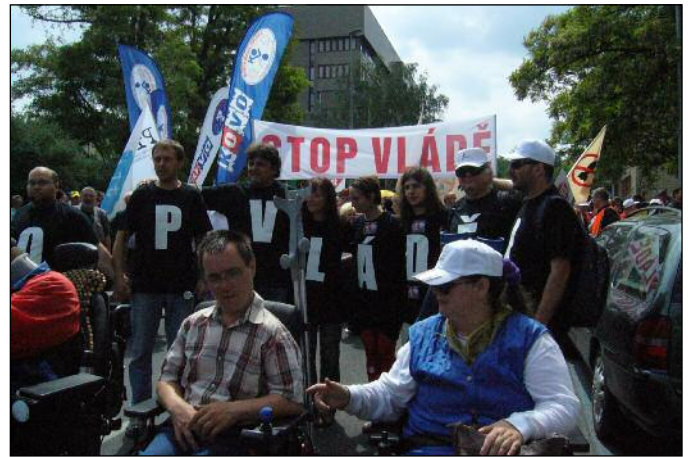
V čele průvodu pojedou aktivisté z Národní rady osob se zdravotním postižením ČR