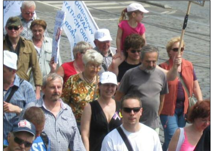
Na nábřeží kpt. Jaroše