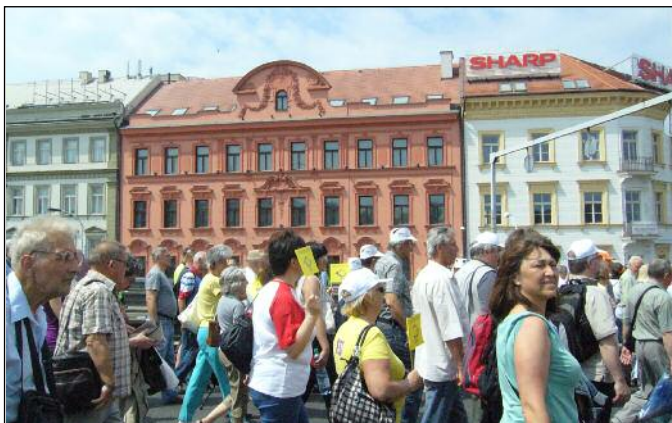
Protestující na magistrále