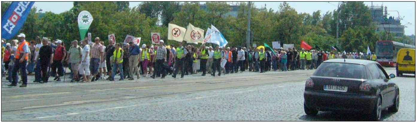
Had průvodu na Hlávkově mostě