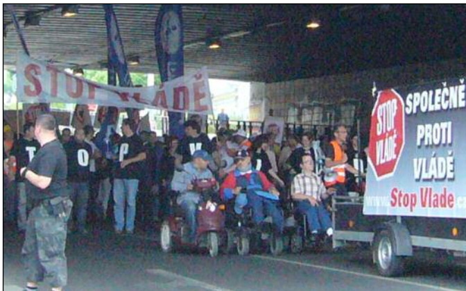
U Bulhara protestující prochází pod železničním mostem