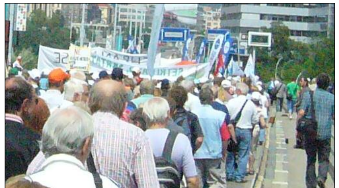
Demonstranti se blíží k Florenci NOS 11/2012