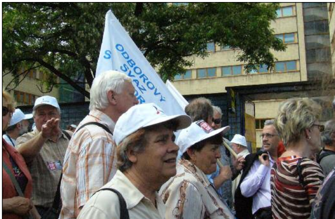
Účastníci se řadí za Domem odborových svazů odkud v poledne vyrazí na 5kilomterový pochod