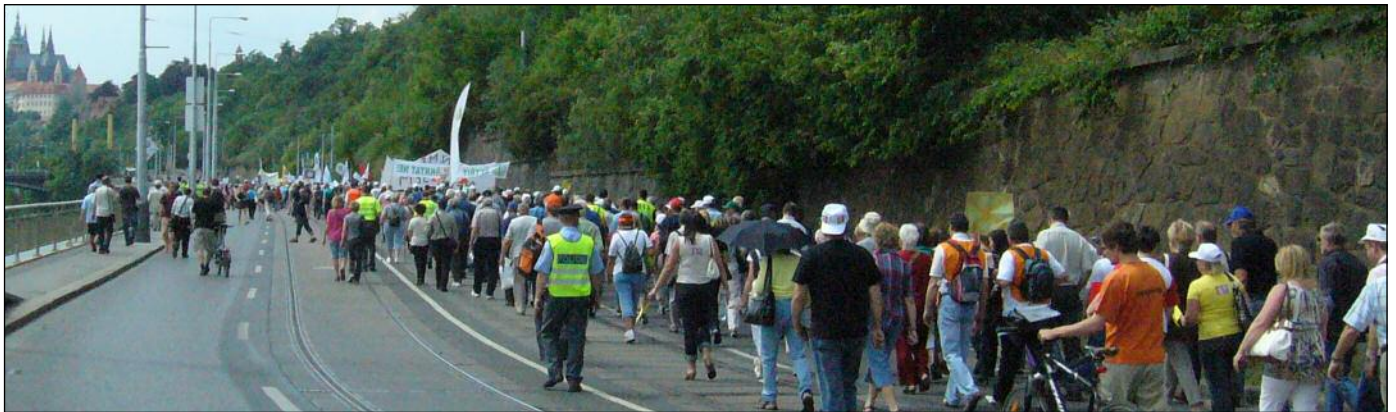
Protestující se blíží k úřadu vlády