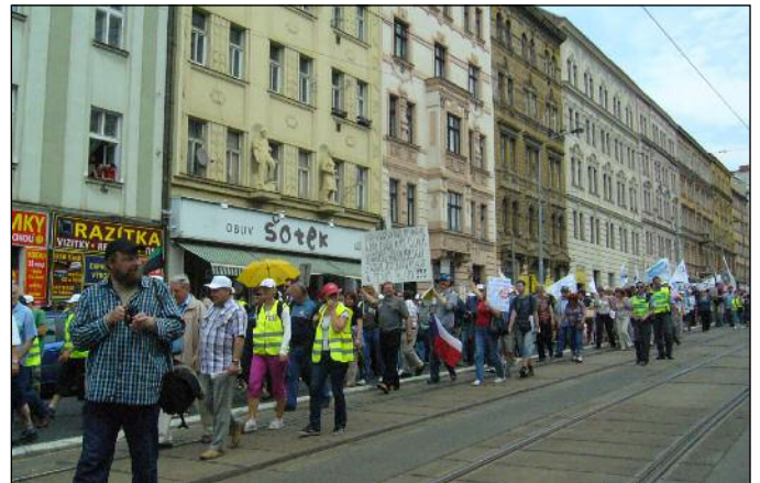
Průvod míří Seifertovou ulicí, ve které je zastavena doprava