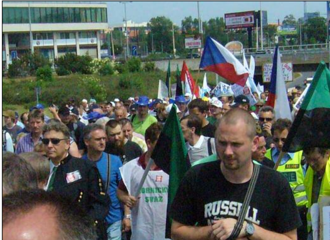
U dopravních podniků