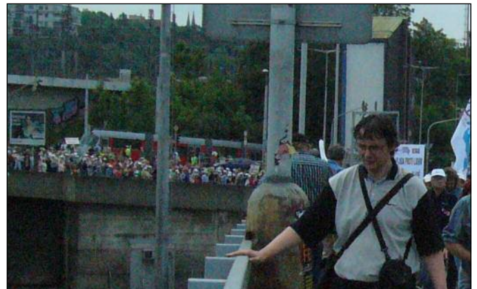
Průvod vchází na magistrálu