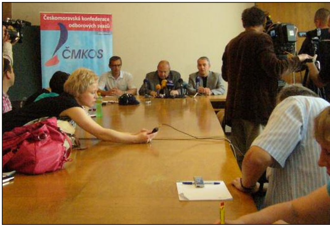
Tisková konference po skončení jednání sněmu Českomoravské konfederace odborových svazů 22. 5. 2012, za chvíli začne protest