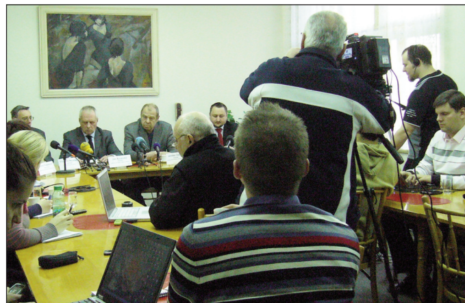
Bezprostředně po jednání Podnikového výboru odborových organizací Úřadu práce ČR se konala tisková konference

Rekreační zařízení Smrk v Libverdě, rok 2012