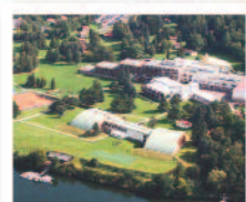
SLAPSKÁ PŘEHRA Hotel Měřín*** superior www.merin.volareza.cz