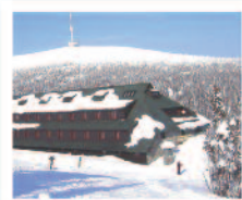
JESENÍKY Hotel Ovčárna *** www.ovcarna.volareza.cz