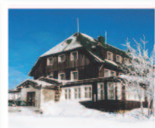
KRKONOŠE Penzion Malý Šišák** www.malysisak.volareza.cz