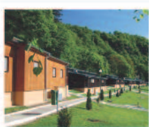
VRANOVSKÁ PŘEHRA Chatová osada Bítov** www.bitov.volareza.cz