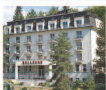
KARLOVY VARY Hotel Bellevue*** www.bellevue.volareza.cz