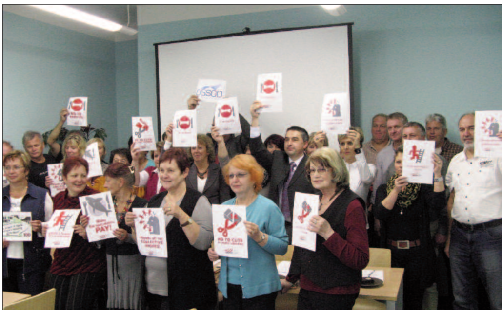
Účastníci jednání podpořili kampaň Evropské federace odborových svazů veřejných služeb NE úsporám

všech základních organizacích zajistit jejich správné označení a sounáležitost s OS SOO (správné názvy, otisky razítek, sídla zaměstnavatelů, identifikační čísla