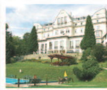
JESENÍK Lázeňský dům Albatros*** www.jesenik.volareza.cz