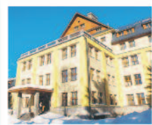
KRKONOŠE Hotel Bedřichov*** superior www.bedrichov.volareza.cz

Rezervujte si letní dovolenou, lyžařský pobyt, lázně, wellness pobyt či firemní akci prostřednictvím kterékoliv rezervací platformy na www.stránkách jednotlivých hotelů výhodně!