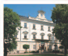
TEPLICE Lázeňský dům Judita*** www.teplice.volareza.cz