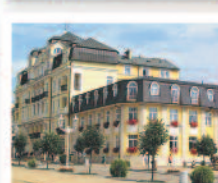
FRANTIŠKOVY LÁZNĚ Lázeňský dům Klášter*** www.frantiskovy-lazne.volareza.cz