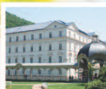
KARLOVY VARY Lázeňský dům Sádlový Pramen*** www.sadlovypramen.volareza.cz