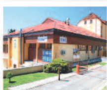
VRANOVSKÁ PŘEHRA Volareza - hotel Vranov*** www.vranov.volareza.cz