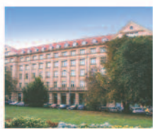
PRAHA Hotel DAP*** www.daphotel.cz