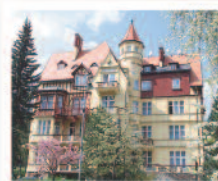
KARLOVY VARY Lázeňský dům Chlapci** www.chlapci.volareza.cz