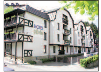
Nabídka ozdravných pobytů pro členy OS SOO na rok 2014 strana 7